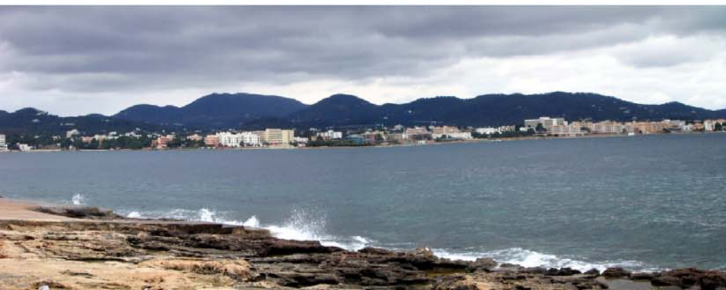
statt der geplanten Wanderung auf den Sa Talaia