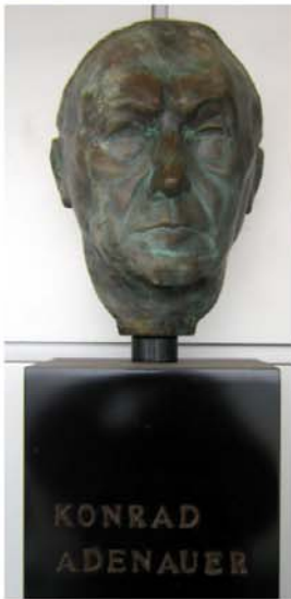
Hinflug vom Konrad-Adenauer-Flughafen Köln / Bonn