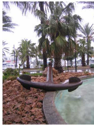
Spaziergang zu einem Hippiemarkt am Abreisetag