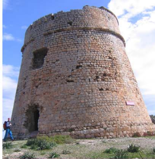
CONSELL INSULAR D'EIVISSA I FORMENTERA TORRE DES CARREGADOR SEGLE XVI