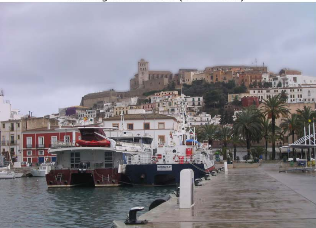
Ausflug nach Eivissa (Ibiza-Stadt)